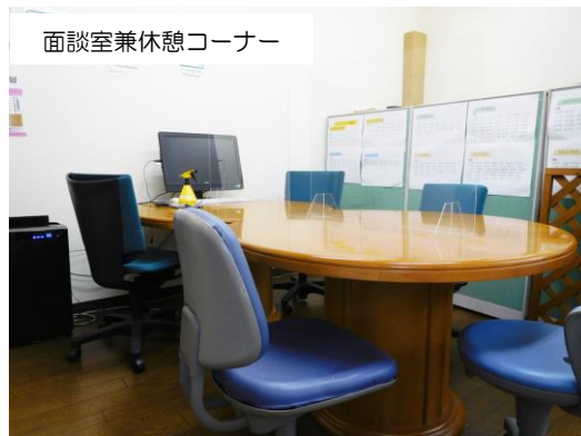
面談室兼休憩コーナー

入口に非接触型体温測定機と消毒液、体調管理表を設置し、施設内は空気清浄機4台及び加湿器にて安心・安全に訓練ができる体制を整えています。 また、二酸化炭素濃度測定器を設置し、換気が十分に行われていることを可視化しています。