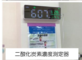
二酸化炭素濃度測定器

入口に非接触型体温測定機と消毒液、体調管理表を設置し、施設内は空気清浄機4台及び加湿器にて安心・安全に訓練ができる体制を整えています。 また、二酸化炭素濃度測定器を設置し、換気が十分に行われていることを可視化しています。