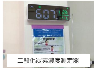
二酸化炭素濃度測定器

入口に非接触型体温測定機と消毒液、体調管理表を設置し、施設内は空気清浄機4台及び加湿器にて安心・安全に訓練ができる体制を整えています。また、二酸化炭素濃度測定器を設置し、換気が十分に行われていることを可視化しています。