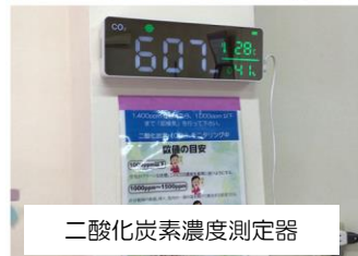
二酸化炭素濃度測定器

入口に非接触型体温測定機と消毒液、体調管理表を設置し、施設内は空気清浄機4台及び加湿器にて安心・安全に訓練ができる体制を整えています。また、二酸化炭素濃度測定器を設置し、換気が十分に行われていることを可視化しています。